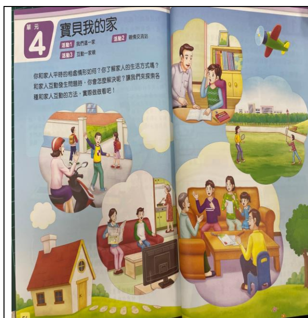
照片說明： 課程地圖