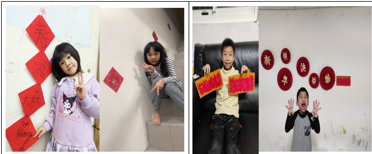
照片說明:在家製作春聯並和家人一起布置家裡，做為寒假作業，要傳照片給老師。