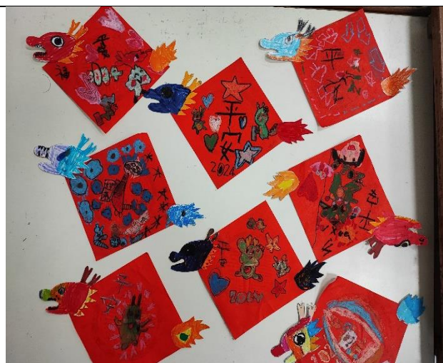
照片說明：龍年要怎麼設計創意春聯才會又漂亮又有變化呢？色彩怎麼搭配？寫什麼字和使用什麼圖？怎麼裝飾？使用什麼材料？