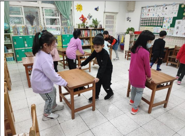
照片說明：大掃除，學習環境清潔整理和布置。