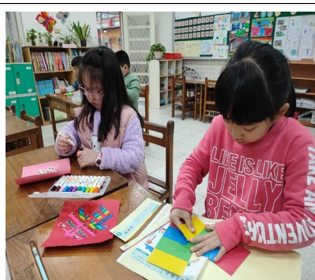
照片說明：運用附件及自己準備相關材料，製作設計春聯。