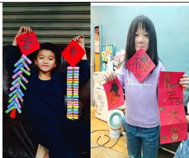
照片說明：在家製作春聯並和家人一起布置家裡，做為寒假作業，要傳照片給老師。