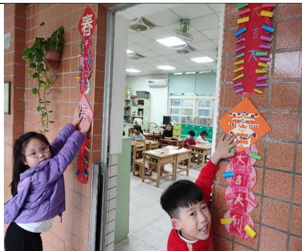
照片說明：將設計製作好的創意春聯，合力將春聯貼在教室。