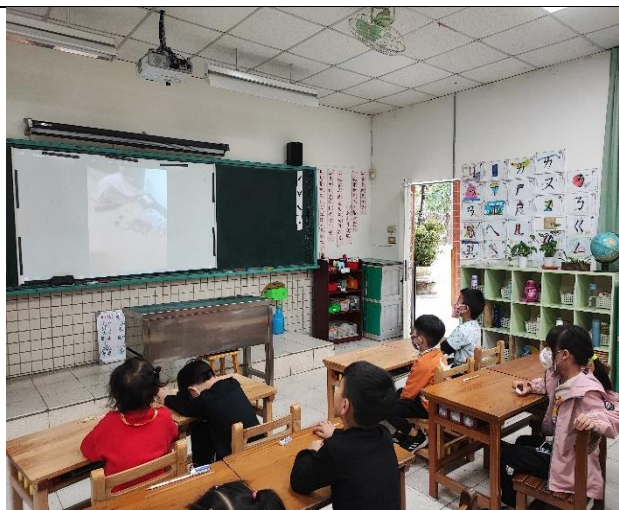
照片說明：寒假作業做家事，開學後，大家一起來欣賞每個同學做了哪些家事？