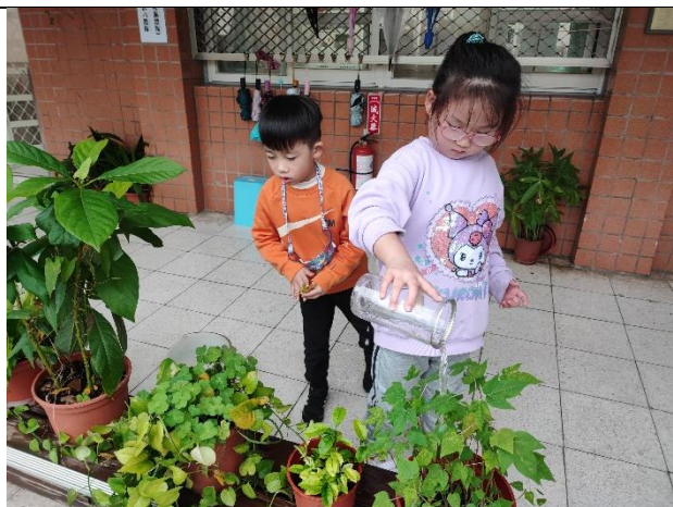
照片說明：大掃除，學習環境清潔整理和布置。