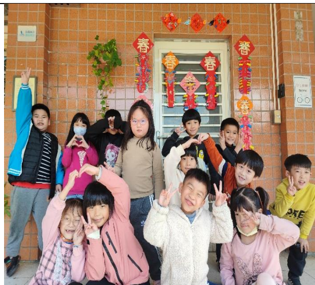
照片說明：透過自製創意春聯，布置環境以營造年節的氣氛。