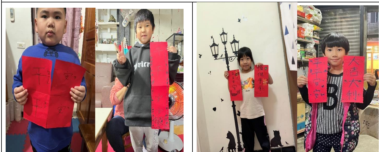
照片說明:在家製作春聯並和家人一起布置家裡，做為寒假作業，要傳照片給老師。