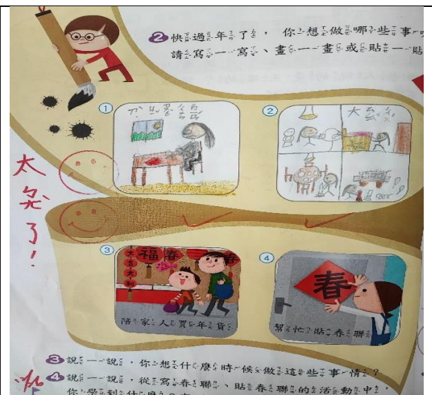
照片說明：孩子的習作表現