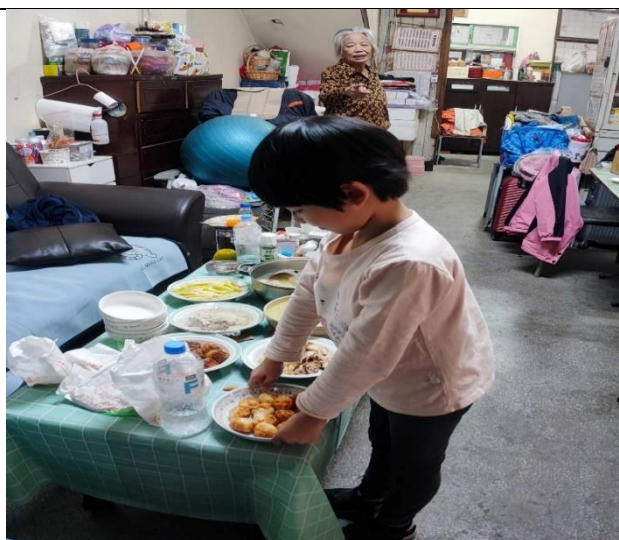
照片說明：「過年前，家人通常會做哪些準備工作？」學習清潔整理和布置家裡。