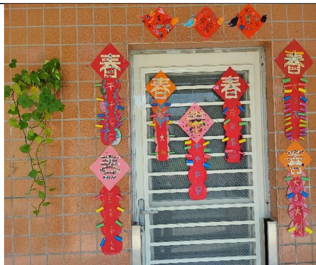
照片說明：透過自製創意春聯，布置環境以營造年節的氣氛。