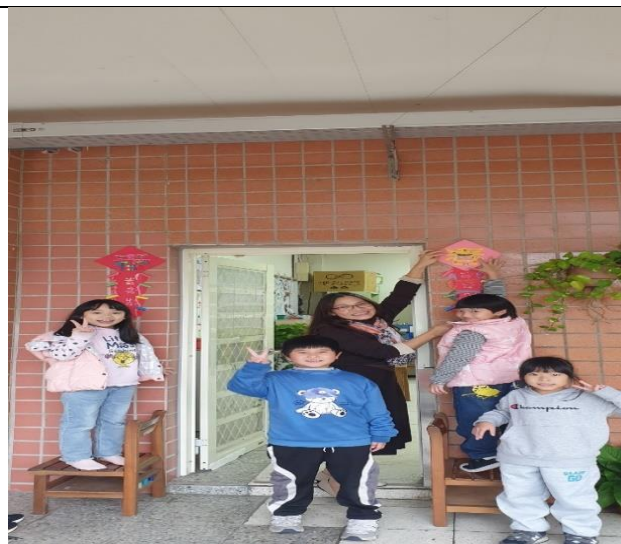
照片說明：將設計製作好的創意春聯，合力將春聯貼在教室。