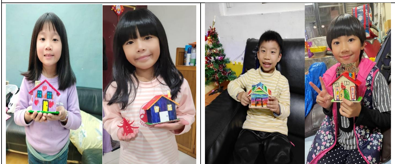
照片說明:和家人一起規畫壓歲錢的運用，在家彩繪存錢筒，做為寒假作業，要傳照片給老師。