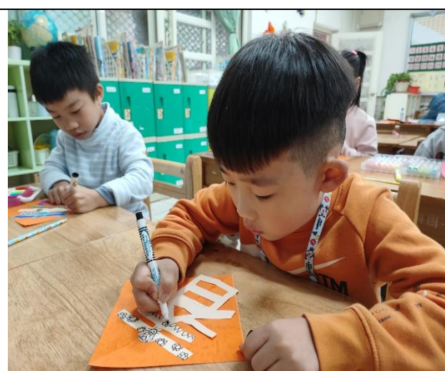
照片說明：運用附件及自己準備相關材料，製作設計春聯。