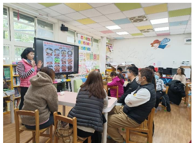
照片說明：配合親職講座進行家庭教育中健康體位、食品健康與安全宣導