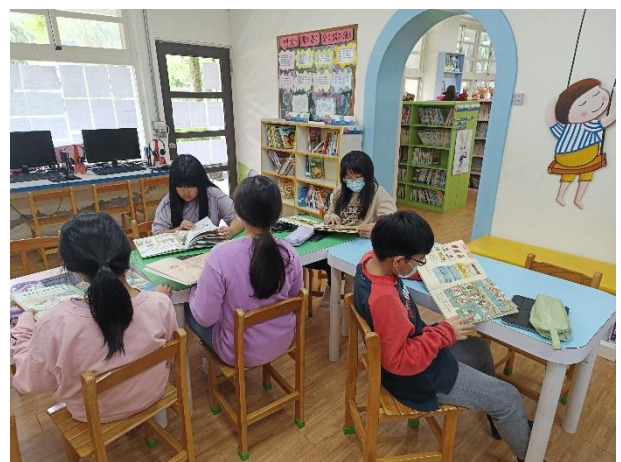
照片說明：孩子們於圖書室閱讀關於食品安全及家庭食品採購等佈展書籍