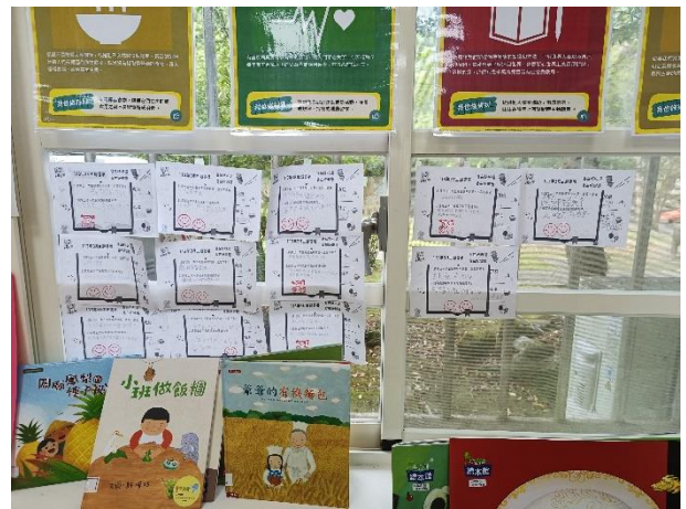
照片說明：閱讀三月份主題書展中佈展書籍，並且完成閱讀任務單。