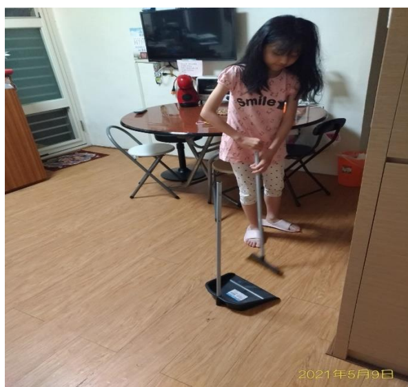
照片說明:幫忙做家事(掃地)