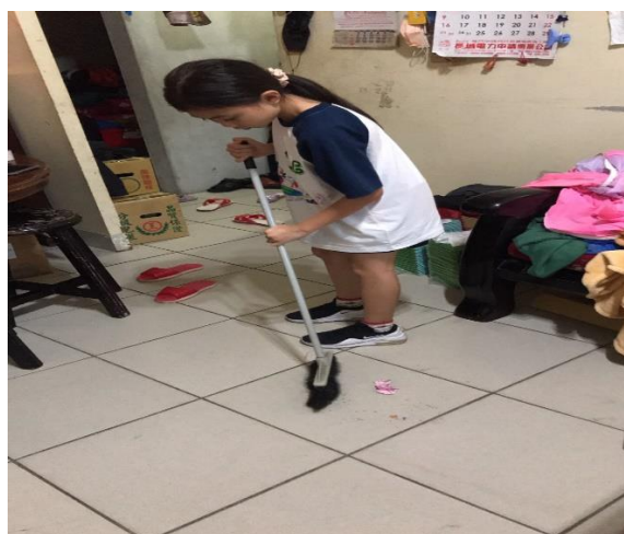
照片說明:幫忙做家事(掃地)