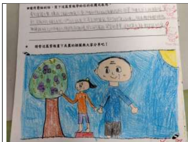
照片說明:讀報指導(寫感想並插圖)