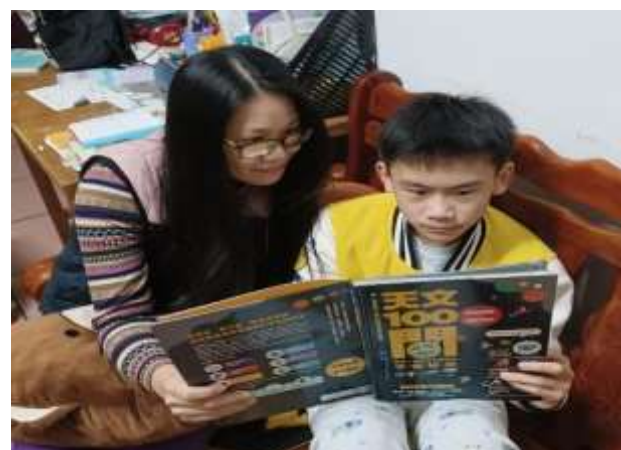
照片說明: 親子共讀