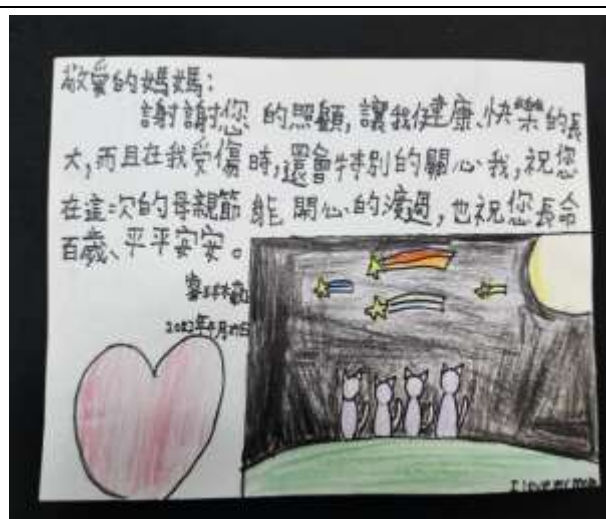
照片說明：省思與家人間的互動