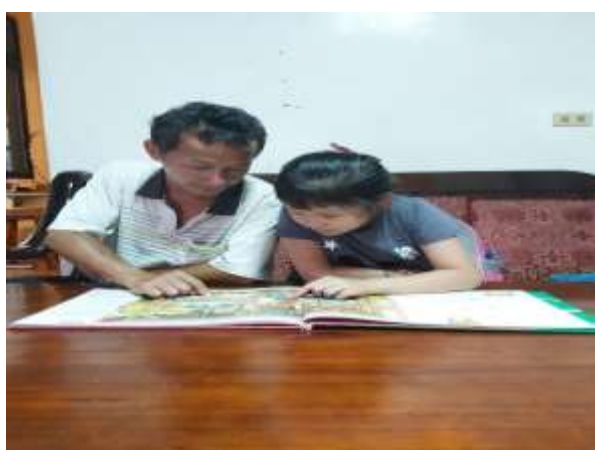
照片說明:親子共讀