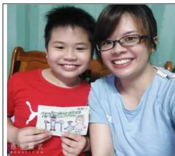
照片說明：母親節(寄送明信片)