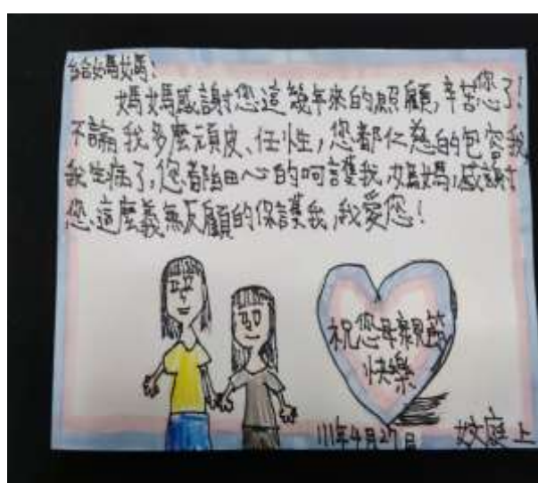
照片說明：省思與家人間的互動